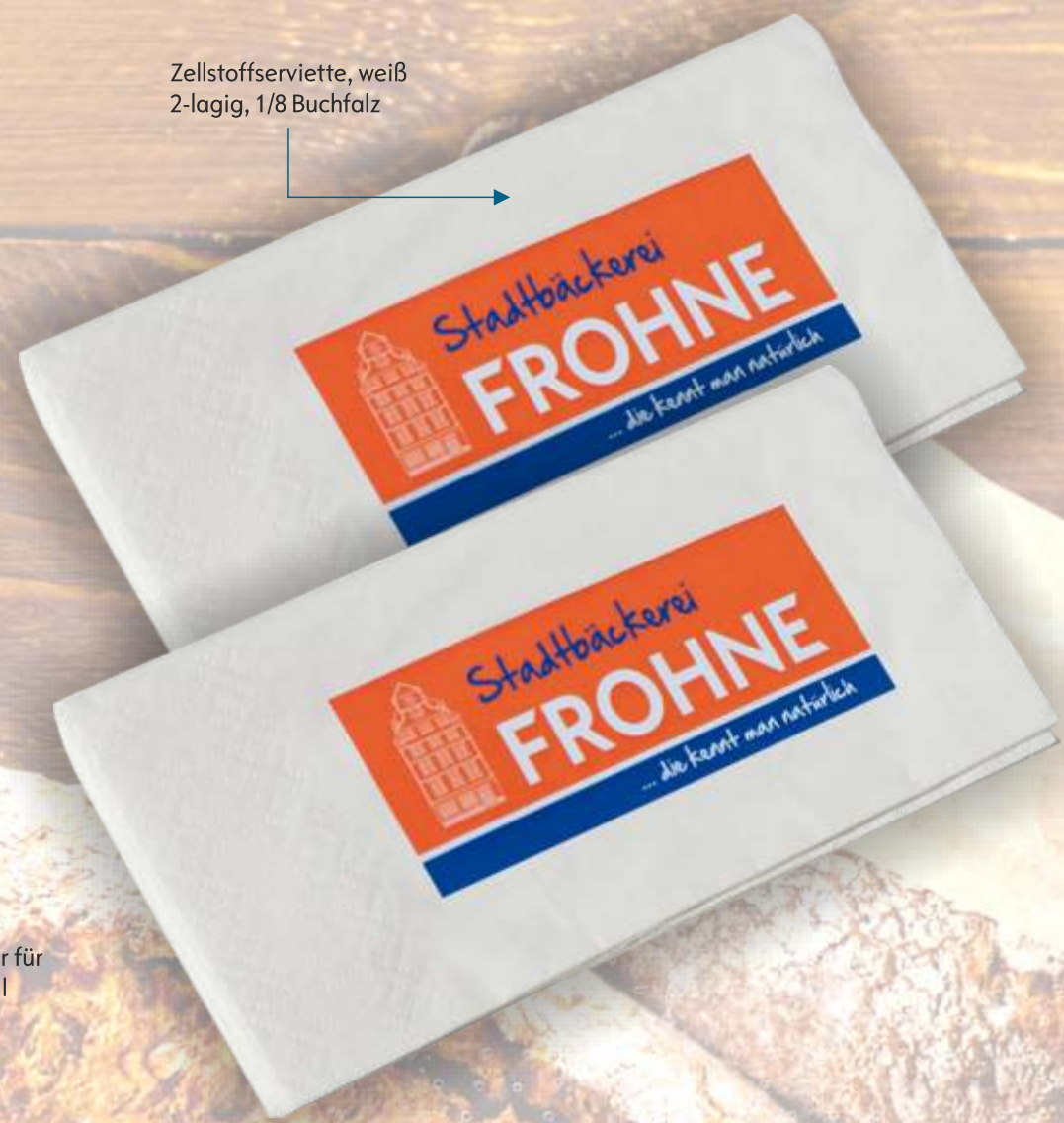
Zellstoffserviette, weiß 2-lagig, 1/8 Buchfalz

Servietten Eine Serviette gehört zu jedem Außer-Haus-Verkauf! Runden Sie Ihre Werbung mit einer bedruckten Serviette ab. So behält Ihr Kunde Sie und Ihren Service auch nach dem Mahl in guter Erinnerung. Servietten mit Werbedruck liefern wir in unterschiedlichen Formaten, ein und mehrlagig in den Ausführungen Viertel und Achtfelz, je nach Ausführung bereits ab 20.000 Stück.