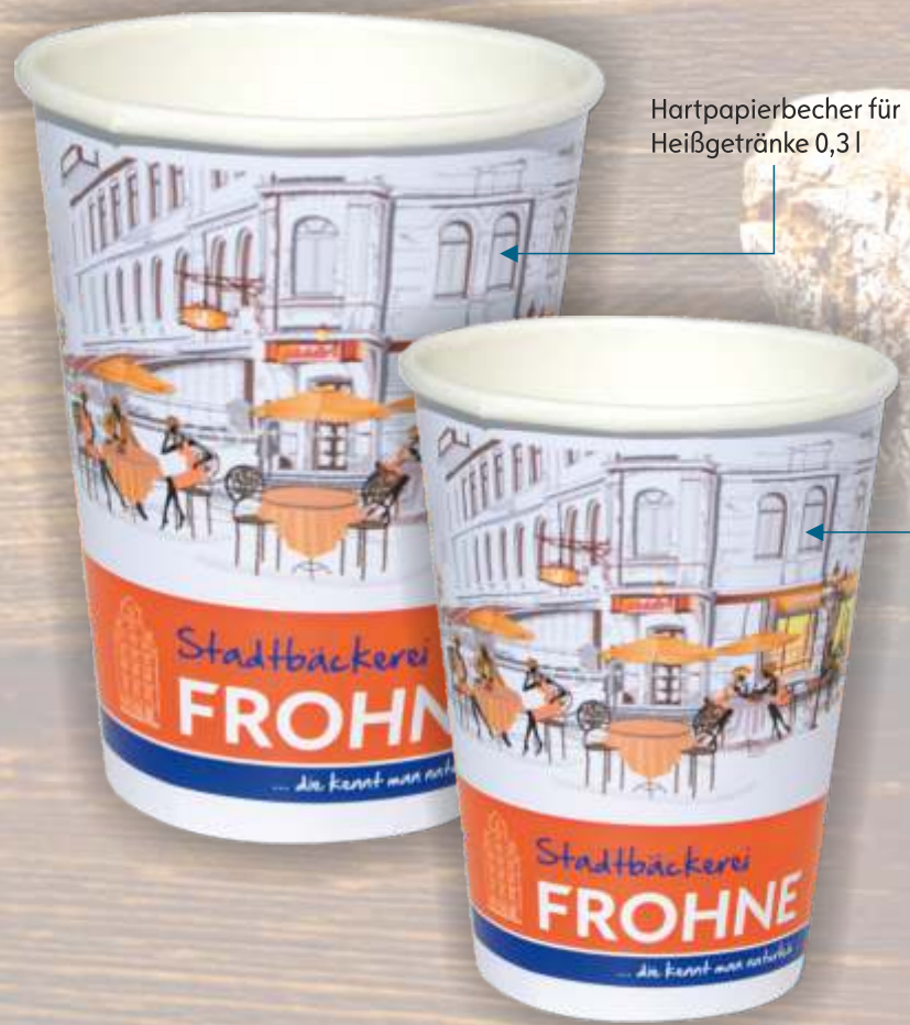
Hartpapierbecher für Heißgetränke 0,3 l

Coffee to go Inzwischen ein Klassiker in diesem Bereich der Außer-Haus-Verpackungen sind Coffee to go Becher. Diese sind in den Volum 0,1, 0,2, 0,3 und 0,4 l in einwandiger, doppelwandiger und geriffelter Ausführung lieferbar, natürlich mit den passenden Deckeln. Mit Ihrem Werbedruck produzieren wir diese Becher bereits ab einer Auflage von 25.000 Stück.