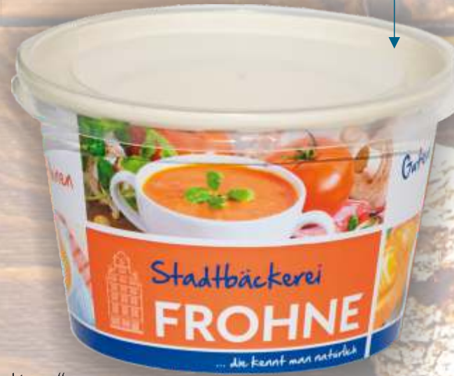
Hartpapierbecher „soup to go“ mit transparentem Deckel

Wir liefern Ihnen die dafür passende Verpackung, gerne mit Ihrem Werbedruck!