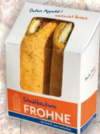
Wrapbox mit Sichtfenster