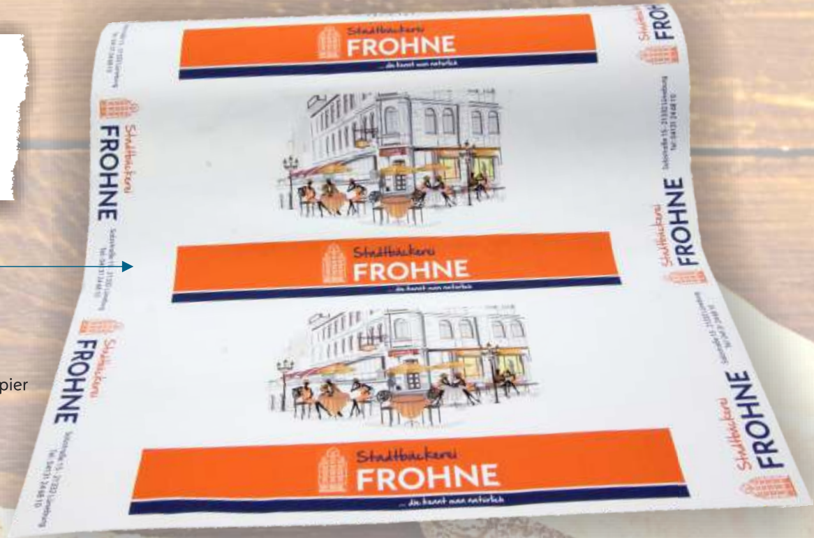
Secare Rolle 50 cm breit weiß Kraftpapier