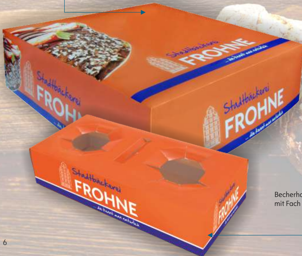
Tortekarton mit anhängendem Deckel