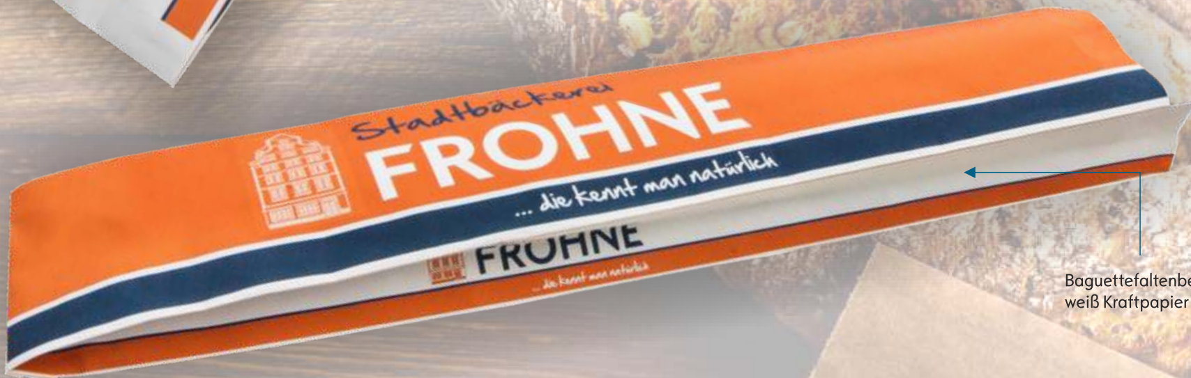
Baguettefaltenbeutel weiß Kraftpapier

Einschlagpapier bieten wir Ihnen auf Secare Rollen in Breiten von 30 und 50 cm, in den Qualitäten weiß gebleicht Kraft und braun Natronkraft, ab 12 Rollen à 10 kg, mit bis zu vier Farben.