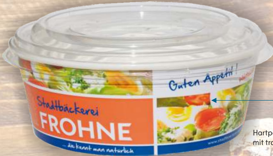
Hartpapierbecher „salad to go“ mit transparentem Deckel