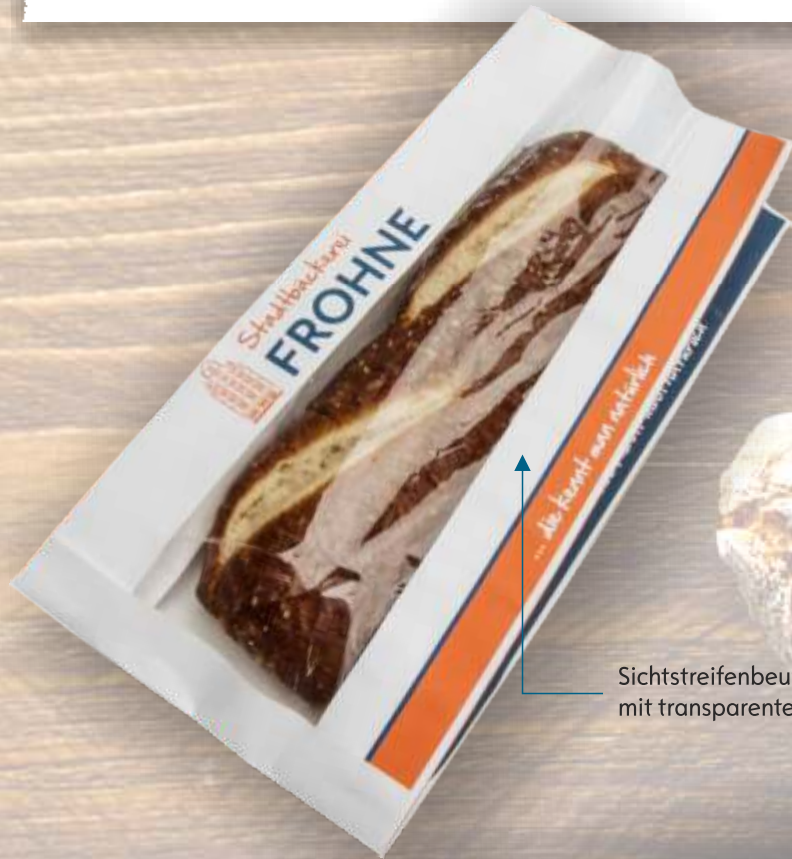
Sichtstreifenbeutel, weiß Kraftpapier mit transparentem PP-Sichtfenster

Baguettefaltenbeutel aus weiß gebleicht Kraft oder braun Natron sind in mehreren Standardgrößen ab einer Auflage von 12.000 Stück mit individuellem Druck lieferbar.